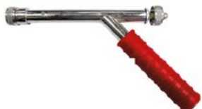
HZ-20A CRI 6684