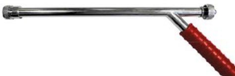
HZ-40A CRI 6686