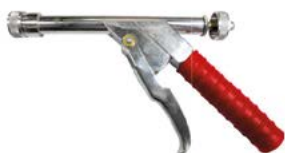
HZ-20GT CRI 6685