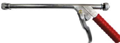
HZ-40GT CRI 6687