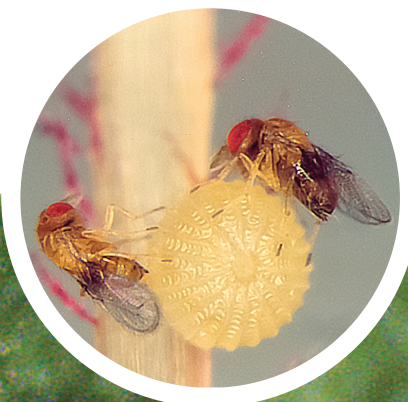
Pretiobug ( Trichogramma pretiosum ) parasitando ovo de lagarta