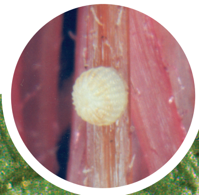
Ovo de lagarta