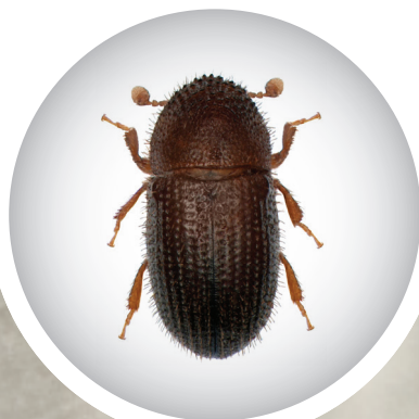
Broca do café ( Hypothenemus hampei )