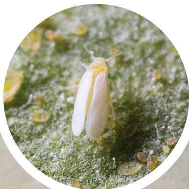
Mosca branca ( Bemisia tabaci )