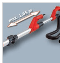
Comprimento máximo de 1,65 m