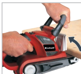
Capa frontal de metal que permite lixamento na parte inferior do tampo de mesa oferecendo maior mobilidade