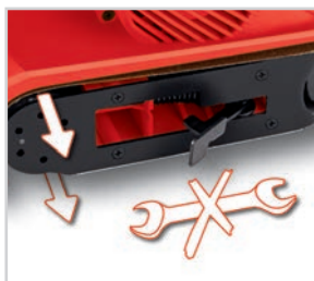
Troca fácil e rápida da lixa