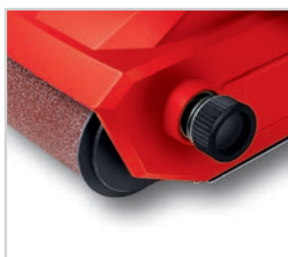
Ajuste fácil da lixa