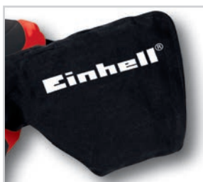
Acompanha saco coletor de pó