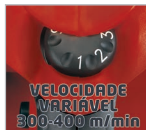
Velocidade eletrônica variável