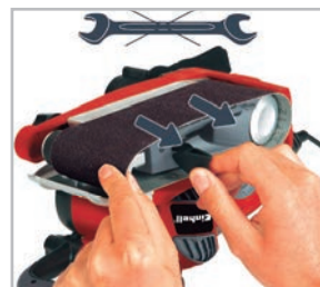
Troca de lixa fácil e rápida